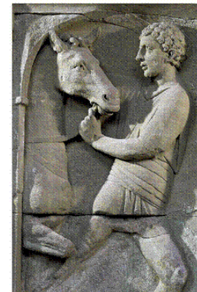
Römischer Sklave mit Pferd. Relief vom sog. Zirkusdenkmal in Neumagen an der Mosel. 2./3. Jh. n. Chr. Trier, Rheinisches Landesmuseum.

a) Beantworte die folgenden Fragen auf Deutsch: 1. Cur Iulia non ridet? 2. Cur equus non parat? 3. Cur Homilia ridet? Überlege: 4. Cur Syrus et Lydus tacent?